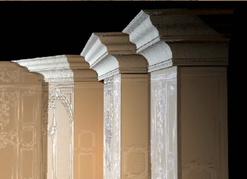
détail des moultures coté cour

les moultures en tête des châssis donnent l'amorce d'un plafond